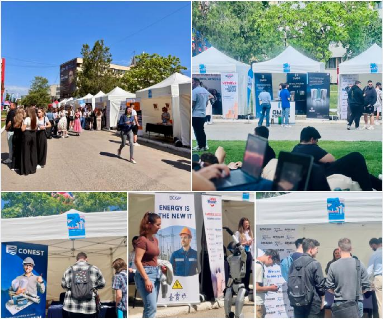
Schneider 1 aprilie 2025